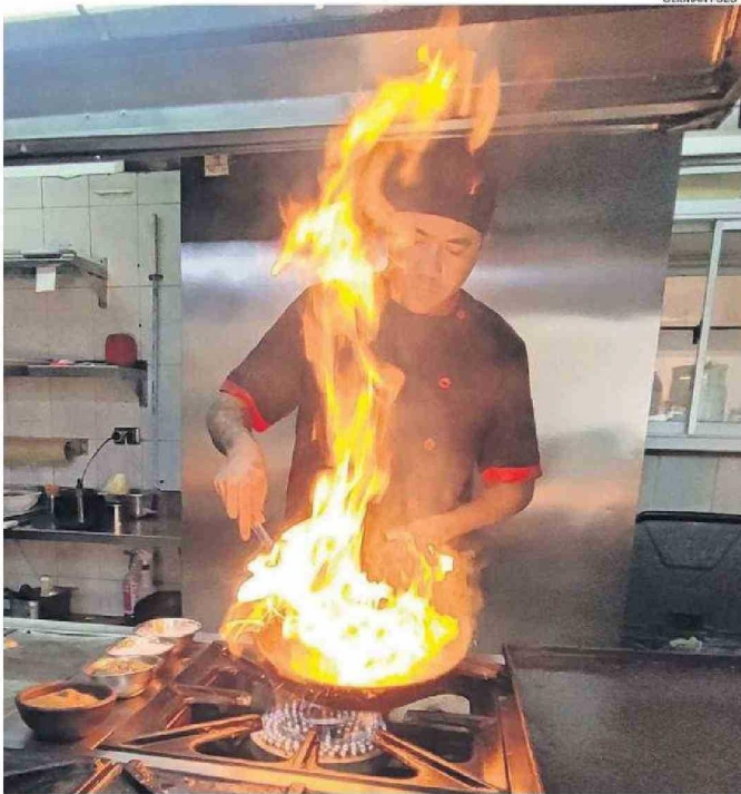
DUÑO DEL NEPTUNO ASEGURÓ QUE, A PESAR DEL ÉXITO DE SU LOCAL, PLANEA DEJAR EL RUBRO.