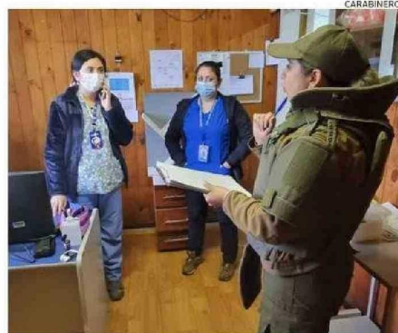
CARABINEROS VISITÓ LOS RECINTOS DE SALUD AFECTADOS.

La ubicación de estos recintos en sectores altamente rurales es un problema para las autoridades, ya que muchos de ellos no cuentan con personal per-