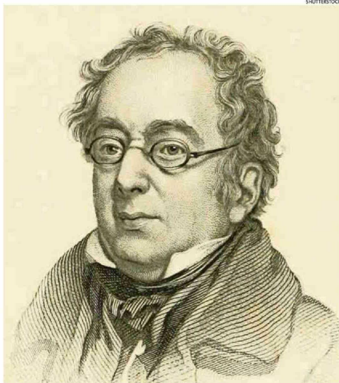
EL BRITÁNICO ISAAC DISRAELI PUBLICÓ "CURIOSIDADES DE LA LITERATURA" EN CUATRO TOMOS, ENTRE 1791 Y 1823.

Al investigar a Isaac Disraeli, continúa González, "descubrí que no había una traducción de su obra más importante. 'Curiosidades de la literatura', que con los años fue acompañada por