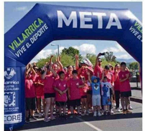
ATLETAS LOCALES, HABITANTES DE LA ZONA LACUSTRE Y TURISTAS ESTÁN INVITADOS A PARTICIPAR EN LA CORRIDA.