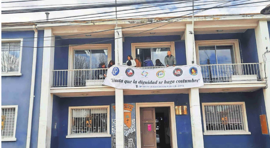
Durante toda la semana profesores de Lota levantaron alarmas debido a que sus sueldos no eran pagados de forma íntegra. Realizaron acciones de protesta en el municipio.

Flancos que siguen abiertos y que estas últimas semanas acapalaron la atención de la comunidad