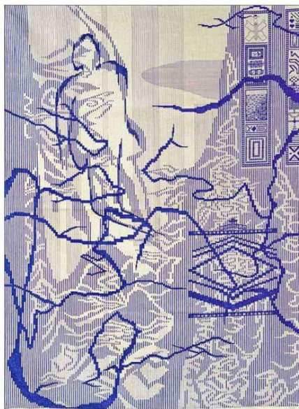
"Mi guatón guapo en la mar" , obra textil de Ignacio Urrutia. El artista recibió el tercer lugar.

Municipal de Santiago, cuyos resultados se presentaron el primer semestre en el Centro Cultural La Moneda. Otros certámenes que apuntalan la escena emergente son el del Museo de Artes Visuales (Mavi-UC), que va en su decimoséptima versión y se presenta ahora, y "Artefacto", convocado por la Corporación Cultural de Vitacura. "Siempre es súper importante apoyar al arte joven desde distintos lugares. Estas instancias son muy relevantes para impulsar sus carreras", agrega la directora del MNBA.