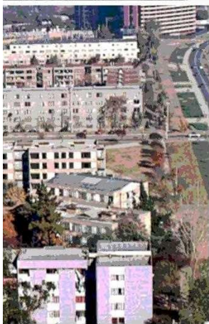
Vista de lo que fue la Villa San Luis antes de que empezara su demolición en 1997.