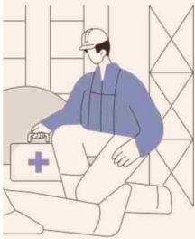
EN BASE A SUSSESO Y AL DE EMPLEO DEL IINE.

“El total de días de licencia al año pagados en promedio por trabajador dependiente del sector público es considerablemente mayor al observado entre trabajadores dependientes del sector privado e independientes.