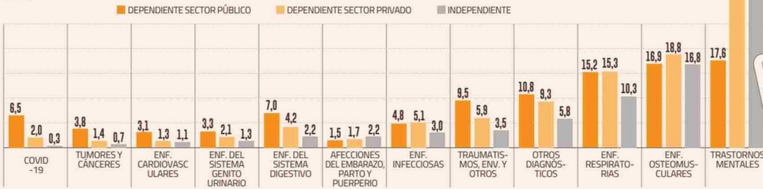
DISTRIBUCIÓN DE LAS LICENCIAS AUTORIZADAS EN 2023 POR GRUPO DE DIAGNÓSTICO SEGÚN TIPO DE TRABAJADOR COMO %