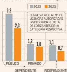
LICENCIAS MÉDICAS AUTORIZADAS EN PROMEDIO POR TRABAJADOR