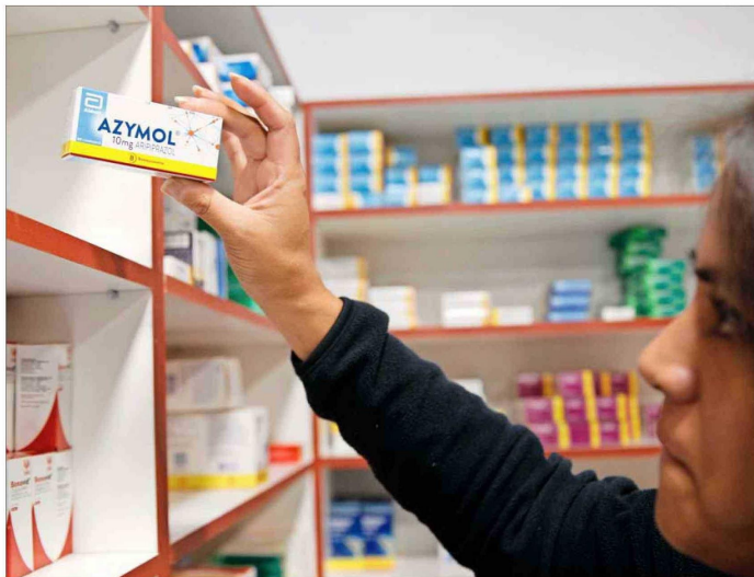
Para los expertos, un gasto importante está vinculado con el costo de los medicamentos, aunque la brecha es amplia según el tipo de aseguramiento de las personas.

ca en que "las coberturas de aseguramiento en relación al gasto promedio hospitalario también han ido disminuyendo y, por lo tanto, eso también incide directamente en el gasto de bolsillo".