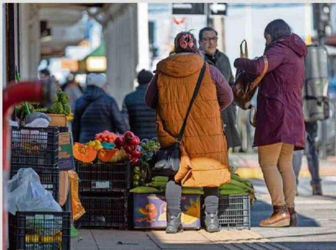
PARA WEIL, SE REQUIERE DE INCENTIVOS ECONÓMICOS PARA REDUCIR LA TASA DE INFORMALIDAD LABORAL.

Entre los aspectos relevantes negativos del año, se centró en la persistencia del alto nivel de economía informal. "La región exhibe un alto grado de actividades ilegales que desregulan el funcionamiento de los mercados locales del trabajo y venta de mercancías. Esta evolución económica y social disfuncional se mantiene elevada y se conso-