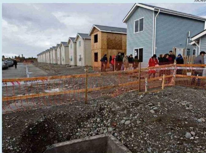
EL AVANCE DEL PLAN DE EMERGENCIA HABITACIONAL, DESTACÓ -ENTRE OTROS- EL SEREMI DE ECONOMÍA.

programa Desarrollo Productivo Sostenible (DPS), "que busca impulsar una matriz productiva más sostenible y sofisticada, mediante la incorporación de mayor conocimiento, innovación y tecnología, hemos financiado diversas iniciativas regionales por más de $4.825 millones".