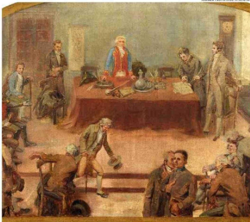
ESTA OBRA PINTADA EN 1889 POR NICOLÁS GUZMÁN BUSTAMANTE RECREA EL CABILDO DEL 18 DE SEPTIEMBRE DE 1810.

Esta fórmula va desarticulando el poder de España en el continente y eso nos afecta positivamente (...) al mirarlo como