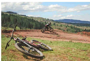
Parque CMPC Junquillar, en Angol.