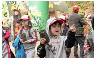
Los diversos circuitos del nuevo parque son un gran atractivo para los niños.

Con una extensión de 1.783 hectáreas, el parque CMPC Lastarria invita a la comunidad de Loncoche y sus alrededores a disfrutar de una variedad de actividades deportivas en sus nueve pistas de mountain bike y dos senderos para trekking y trail running . Además, ofrece la posibilidad de conectarse con la naturaleza, disfrutar de imponentes vistas desde sus miradores, o compartir en familia en la zona de juegos infantiles y área de picnic. El parque se integra al proyecto Bosque Vivo de CMPC, que cuenta con el apoyo de Outlife, una empresa especializada en la creación de espacios al aire libre. Esta iniciativa tiene como objetivo poner en valor los servicios ecosistémicos que ofrecen los bosques y plantaciones forestales, subrayando su papel fundamental en el bienestar de las personas. Sobre el proyecto, Luis Felipe Gazitúa, presidente de Empresas CMPC, comentó que "empresas privadas como nosotros, del tamaño, la significación que tenemos en Chile, debemos hacer las cosas bien. Somos compañías llamadas a ser un factor de desarrollo y este parque es parte de lo que consideramos el desarrollo de las personas. Abri nuestros bosques para la comunidad significa mostrar el valor que tiene el bosque nativo conviniendo con las plantaciones productivas, mientras se ofrece una oportunidad a la gente para que disfrute de la naturaleza y el deporte al aire libre, que es algo muy valioso". La ceremonia de inauguración contó con la presencia