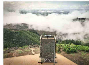
Parque CMPC Pumalal, en Temuco.

ques donde se pueden disfrutar espacios abiertos y una amplia variedad de actividades al aire libre. En estos parques se pueden encontrar plazas recreativas con pump-track y juegos infantiles, senderos de trekking y mountain bike , pasarelas para caminatas en distintos tipos de bosques, señalización educativa y direccional para hacer trekking autoguiado, puntos de descanso, miradores, hitos arquitectónicos y mucho más. Más información en www.bosquevivocmpc.com