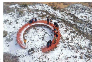
Parque CMPC El Condor, en Coyhaique.