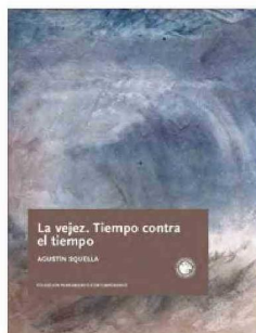
«La vejez. Tiempo contra el tiempo» Agustín Squella Ediciones UDP, Santiago, 2024, 274 páginas.

Soy positiva por opción. He tenido el privilegio de llegar a mis 77 años en buenas condiciones físicas y mentales (con detalles), rodeada del cariño de mi familia, con mis necesidades materiales básicas cubiertas y, como decía Roberto Carlos, «con un millón de amigos». Cuando cumplí los 70, me di cuenta de que para los demás yo era una anciana y me aboqué a entender esta nueva generación que