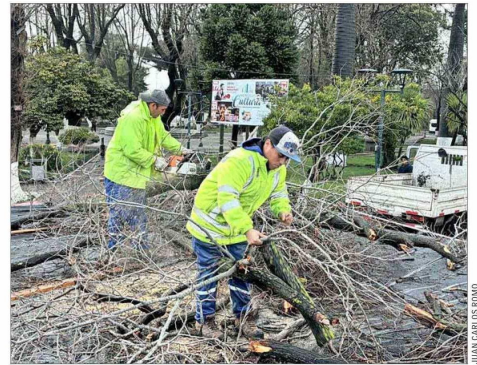
ÁRBOLES SOBRE EL TENDIDO ELÉCTRICO.—Constitución (Maule) fue una de las múltiples localidades del país afectada por pérdida del suministro.

y atendiendo el problema, aquí ha habido una omisión de coordinación de distintos actores, entre ellos, las municipalidades, que también tienen responsabilidades, porque la ley les entrega la potestad de aseo, ornato y mantenimiento de bienes de uso público”.