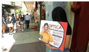
Muchas de las ópticas tienen también en las calles los llamados "captadores" de clientes, que con grandes letreros suelen abordar a los transeúntes de Mac-Iver, Ahumada o alguna galería comercial.

Y es que con más de 650 ópticas en solo pocas cuadras, es difícil encontrar una explicación que tenga alguna lógica económica. Más todavía si se considera que en los locales suelen trabajar más de dos personas —muchas tienen también en las calles los llamados "captadores" de clientes, que con grandes letreros suelen abordar a los transeúntes que caminan por Mac-Iver, Ahumada o alguna galería comercial—, y que la mayoría parte del tiempo pasan vacíos. ¿Cuál es la justificación para esta insólita proliferación? ¿Al otorgarse los permisos municipales a nadie le ha llamado