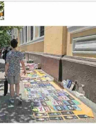
El comercio ambulante a lo largo de la Alameda es otro de los hechos que complican en el sector. En la foto, afuera de la Casa Central de la U. de Chile.