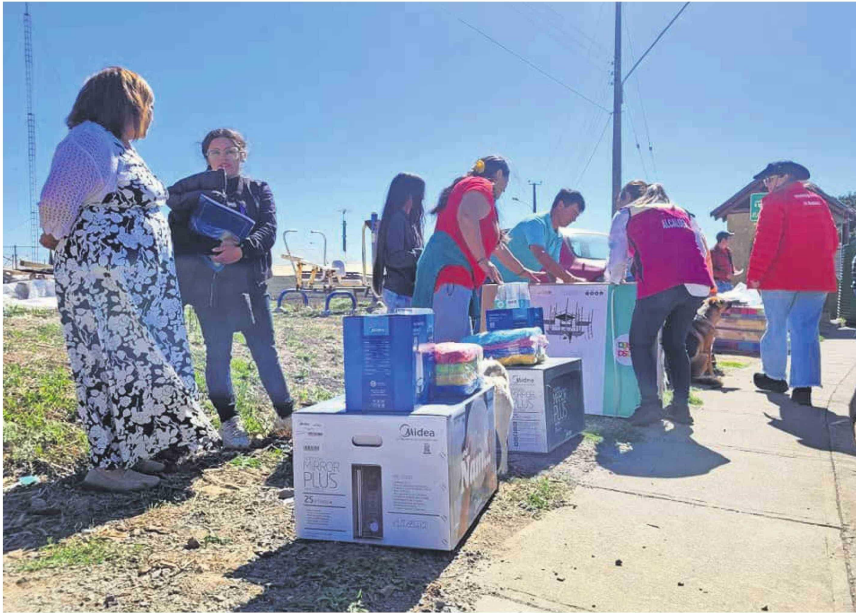
El despliegue producto de los incendios forestales se profundizó en Arauco a partir del verano de 2023. Este es uno de los factores que explica el monto elevado de la comuna.