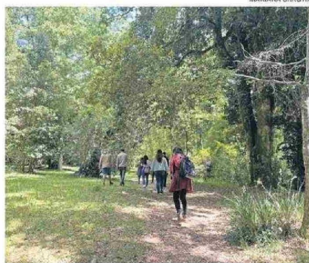
EL PARQUE TIENE 10,5 HECTÁREAS DEDICADAS A LA CONSERVACIÓN.

"Hoy me resulta significativo recordar el hecho que siempre existió como parte de la visión del plan maestro original, dejar parte del terreno, con una clara vocación de conservación y desarrollo de sus prestaciones ecosistémicas naturales. Durante los años en que el Comité Lemu Lahuén ha tenido la responsabilidad de administrar el Parque Urbano, se han desarrollado los actuales senderos y circuitos, sectores de observación y exposición, además de difusión permanente de los beneficios y servicios ecosistémicos que presta actualmente el Parque Urbano a la comunidad y a las personas que acuden regularmente.