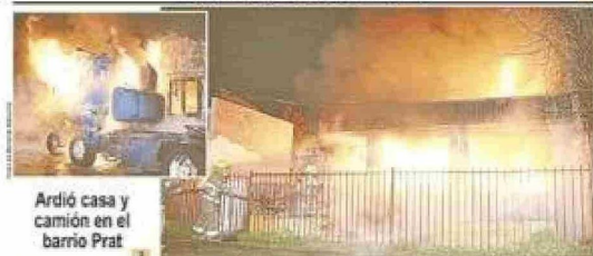
Ardió casa y camión en el barrio Prat