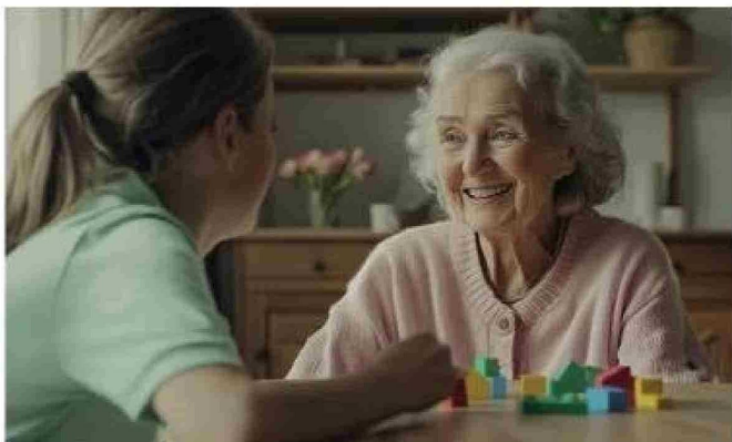
Resultados sugieren que ejercicio y sueño de calidad benefician la salud cerebral diaria.