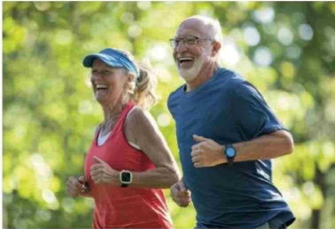
Un estudio del University College London analizó los efectos a largo plazo del ejercicio en la memoria y atención.

Título: Un estudio reciente asegura que hacer ejercicio ayuda a la memoria