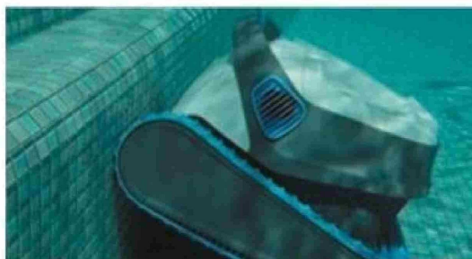
Un robot que limpia su piscina. Su valor en el mercado puede ir desde los $400 mil a $1.500.000.

pertos analizaron las implicancias de esta transformación y advierten sobre los desafíos que plantea.