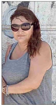
Ximena valoró la piscina municipal y los diferentes espectáculos que se realizan durante la época estival.