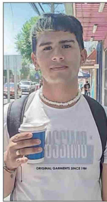
Jesús destacó que tanto el mall como el parque son espacios ideales para que los jóvenes puedan capear el calor.