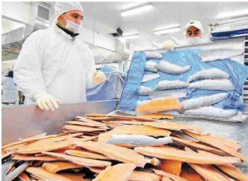
La industria salmonera es el segundo exportador de Chile.

que tiene. Somos el segundo exportador de Chile y muchos de los inversionistas no lo sabían, pero también muchos de los chilenos que asistieron tampoco lo tenían tan claro".