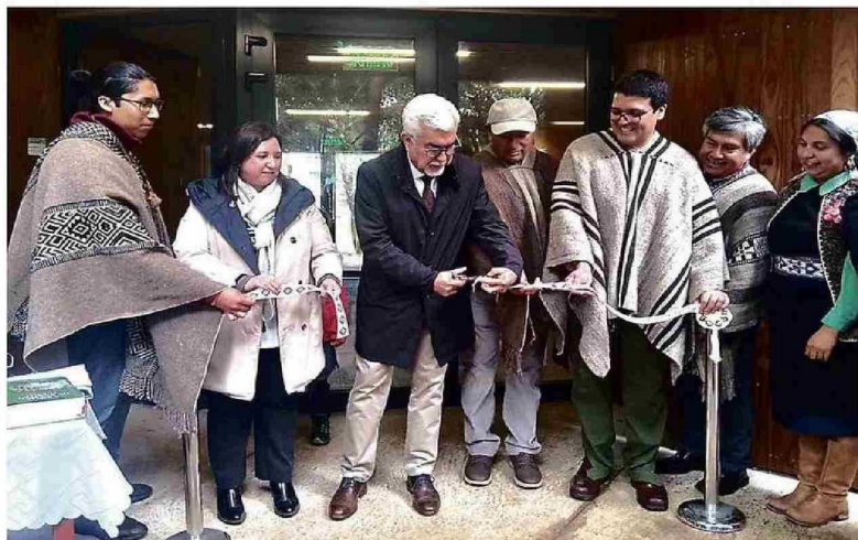
Con la presencia de autoridades universitarias y ancestrales del territorio se inauguró el Centro de Documentación, Enseñanza y Aprendizaje de la Lengua Mapuche, Kimeltuwpeñ.

Dicho compromiso fundacional trazó el camino de la casa de estudios, que en la actualidad representa un eje central de su misión en cada uno de los espacios de la universidad, como un puente que conecta el acceso a la educación con el desarrollo integral de la región, propósito que trasciende entre cada uno de los integrantes de la comunidad universitaria.