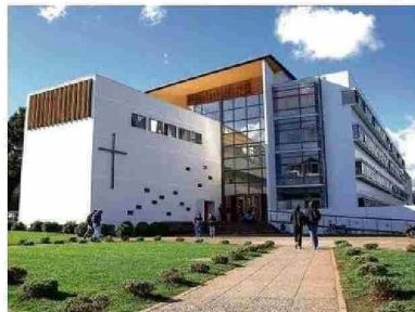
En más de 27615 metros cuadrados construidos, el campus San Juan Pablo 11 aloja 4 facultades.