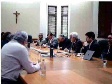
La Mesa Interempresarial es una iniciativa regional liderada por la Universidad Católica de Temuco.

En este ámbito, la Universidad cuenta con una carrera de Pedagogía en Lengua y Cultura Mapuche; un Centro de Documentación y Enseñanza de la Lengua Mapuche; un Núcleo de Investigación en Estudios Interculturales; un