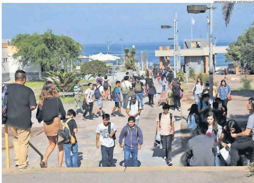
LA POBLACIÓN DE LA REGIÓN DE ANTOFAGASTA SE ACERCA A LOS 30 MIL ESTUDIANTES APROXIMADAMENTE.

Hay otro antecedente comentado, está es una de las generaciones mejor formadas en términos de años de estudio. Hoy, casi todas las autoridades relevantes, pasaron por una institución de educación supe-