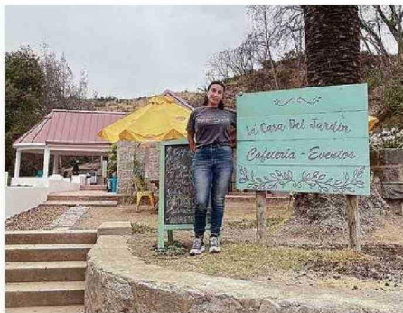
EL LETRERO SE SALVÓ DE LAS LLAMAS, UN SÍMBOLO DE RESISTENCIA.

El Cactario no sufrió daños, y aunque la colección de Valdivia un poco, los árboles ya han comenzado a brotar, mostrando