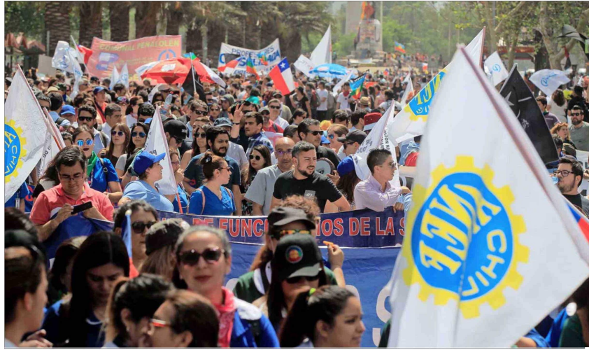
Las estadísticas de funcionarios públicos corresponden a personal del Gobierno Central, municipios, empresas públicas, universidades y centros de formación técnica estatales y otras instituciones públicas. Se excluye a las FF.AA.