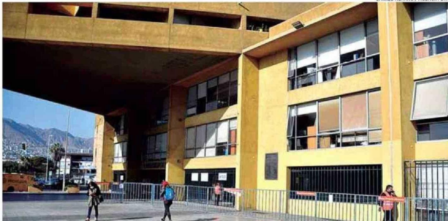
LA MUNICIPALIDAD DE ANTOFAGASTA NO TIENE PROYECTOS CON RS DESDE POR LO MENOS 2021.

Mientras, el consejero Gustavo Carrasco (ind. - PPD) señala que hay pocos proyectos "grandes" presentados por las municipalidades. "El llamado siempre ha sido que los municipios presenten más proyectos y de gran envergadura. Y en eso están al debe los municipios de la región".