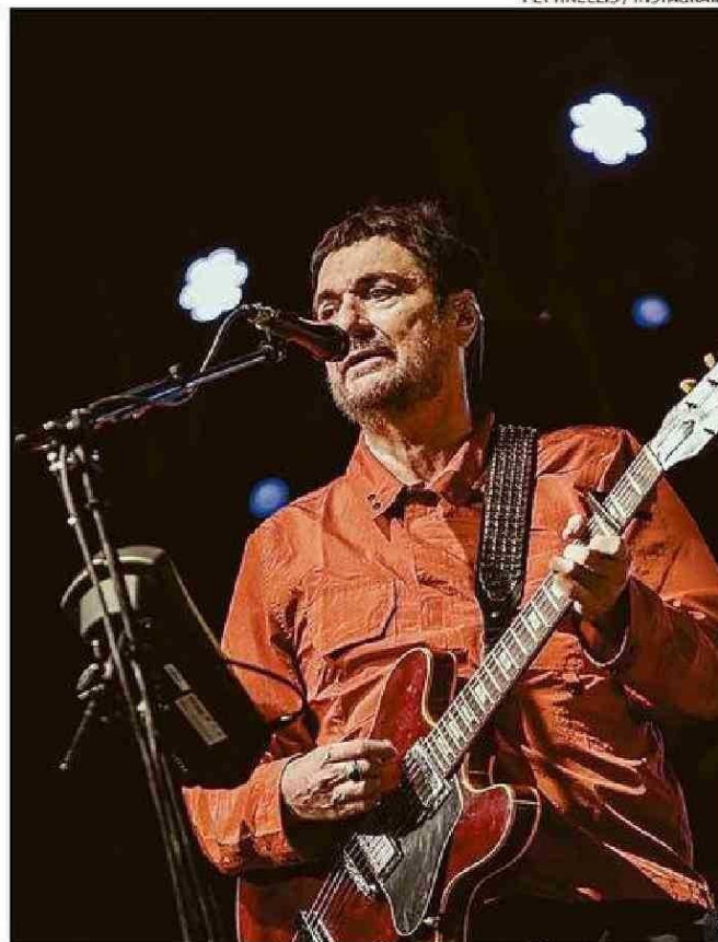
LOS PETTINELLIS SON EL NÚMERO ESTELAR DE ESTE SÁBADO.

Algunos de los nombres agendados para el sábado son Pettinellis ("Hospital"), Gondwana ("Armonía de amor") y Los Ángeles Negros ("Y volveré"), quienes harán una parada única en el país antes de continuar con su gira internacional. El