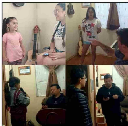
Las clases de canto personalizado las dan en su casa. Mientras que para teatro musical arriendan una sala en la academia de danza Media Punta.