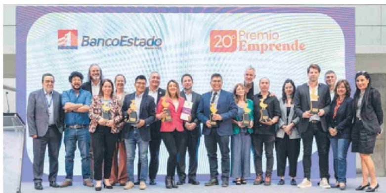
Ganadores del Premio Emprende BancoEstado 2024 junto a ejecutivos de la entidad financiera.