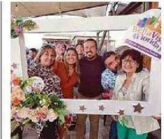
COMERCIAN TES CELEBRAN LOGROS.

“Pese a esto, es un rubro encantador. Si alguien está pensando en levantar un emprendimiento de este calibre, lo invito a que se atreva porque, si bien no se va a hacer millonario, tampoco va a morir de hambre. Les recomiendo a los primerizos hacer publicidad en redes sociales y estar abiertos a escuchar a sus clientes”, finaliza el librero. CS