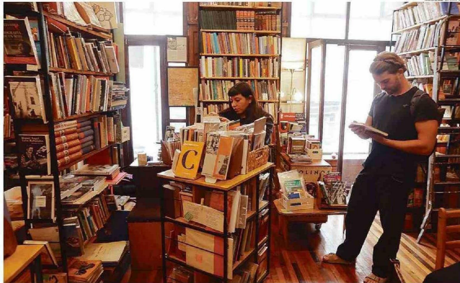
MUCHOS LOCALES SE HAN INSTALADO EN NUEVAS DEPENDENCIAS, INCLUSO EN LOS SEGUNDOS PISOS DE INMUEBLES PATRIMONIALES.

años, aproximadamente, ha funcionado la librería Ateneo, la cual es conocida por sus libros escolares.