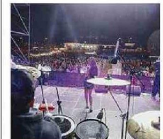
EVENTO PRIVILEGIÓ MÚSICA LOCAL.