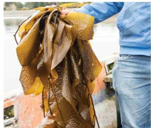
CHILE CUENTA CON ALREDEDOR DE 400 ESPECIES de algas bentónicas, de las cuales solamente 14 se utilizan con fines comerciales, dejando el potencial de estudiar macroalgas.