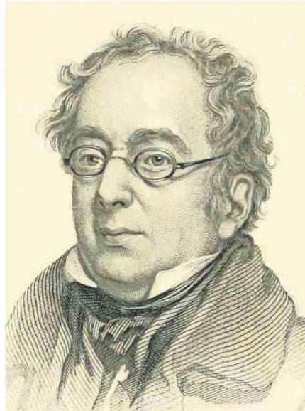
ISAAC DISRAELI PUBLICÓ “CURIOSIDADES DE LA LITERATURA” EN CUATRO TOMOS, ENTRE 1791 Y 1823.

—Yo estaba en Inglaterra y fue muy curioso, porque este era el autor más leído, más popular, una suerte de (Enrique) Lafourcade con “Palomita Blanca”, porque él hacía, lo que se llama en la tradición francesa, misceláneas. Entonces, los procesos de alfabetización que en Inglaterra fueron más rápidos por el protestantismo, al igual que en Alemania, a fines del siglo XVIII, principios del XIX, donde Disraeli escribió mientras la gente se estaba alfabetizando y quería captar cultura rápidamente, donde