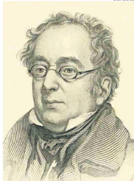
ISAAC DISRAELI PUBLICÓ “CURIOSIDADES DE LA LITERATURA” EN CUATRO TOMOS, ENTRE 1791 Y 1823.

—Yo estaba en Inglaterra y fue muy curioso, porque este era el autor más leído, más popular, una suerte de (Enrique) Lafourcade con “Palomita Blanca”, porque él hacía, lo que se llama en la tradición francesa, misceláneas. Entonces, los procesos de alfabetización que en Inglaterra fueron más rápidos por el protestantismo, al igual que en Alemania, a fines del siglo XVIII, principios del XIX, donde Disraeli escribió mientras la gente se estaba alfabetizando y quería captar cultura rápidamente, donde