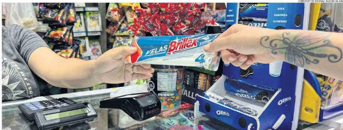
EL CORTE DE LUZ AFECTÓ A 14 REGIONES DEL PAÍS. EN LA REGIÓN FUERON MÁS DE 160 MIL CLIENTES QUE SE VIERON PERJUDICADOS POR EL CORTE DE SUMINISTRO.

EMERGENCIA. Mientras que la totalidad de personas ya estaban con servicio energético, se registraron cortes de agua por problemas en la planta.