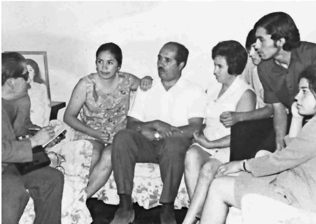
La familia que encontró a la momia durante un paseo en El Salvador para luego entregarla al Museo del Hicaco en Vallena.