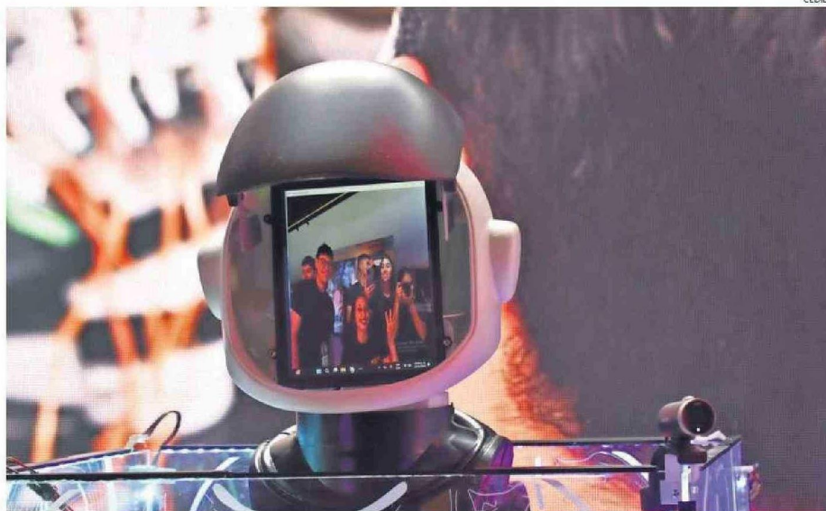
LA CABEZA DE STELARBOT YA ESTÁ LISTA Y SE EXHIBIÓ EN CONGRESO FUTURO 2025. EN EL CASCO SE VERÁ EL ROSTRO DEL USUARIO.