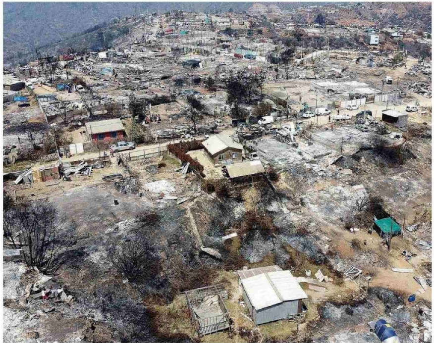
SECTOR POMPEYA, EN QUILPUÉ, AFECTADO POR MEGAINCENDIO DE FEBRERO.

Con el objetivo de desarrollar un trabajo colaborativo que permita mejorar la preparación de la región ante futuros incendios, los gremios de la Asociación de Empresas de la Región de Valparaíso (Asiva), la Cámara Chilena de la Construcción Valparaíso (CChC) y la Cámara Regional del Comercio de Valparaíso (CRCP) confor-