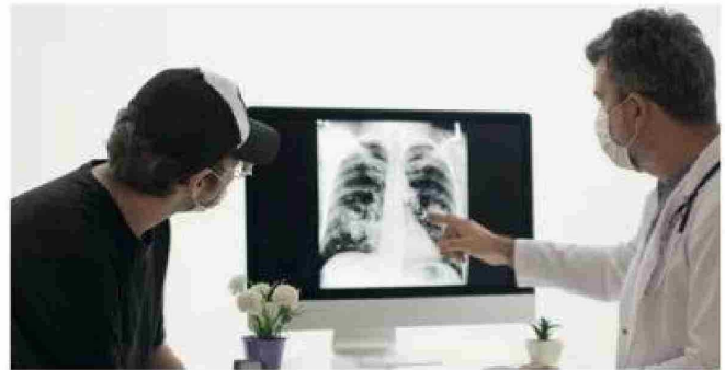
Uno de los factores que influye en que haya más casos de cáncer en hombres es que participan poco en programas de prevención.