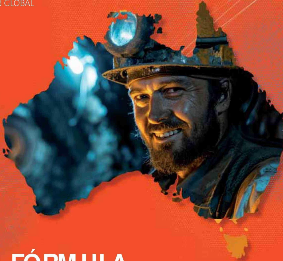
Ilustración: Fabiana Rivero