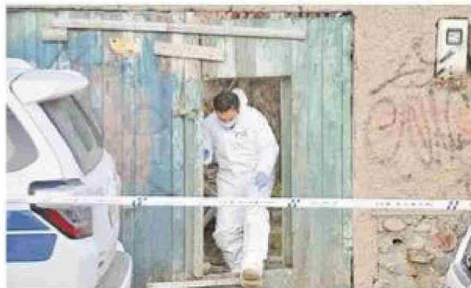
Al ingresar a la propiedad de Eusebio Lillo N°1291, personal de la PDI encontró a las dos mujeres fallecidas.