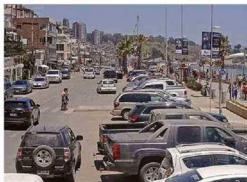
SE HAN RETIRADO UNA TREINTENA DE CARROS DE ALIMENTOS.

chos, lo cual se va a seguir realizando (...)".