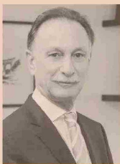
GUSTAVO WEISS PRESIDENTE DE LA CÁMARA ARGENTINA DE LA CONSTRUCCIÓN (CAMARCO).