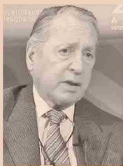
DANIEL FUNES DE RIOJA PRESIDENTE DE LA UNIÓN INDUSTRIAL ARGENTINA (UIA).