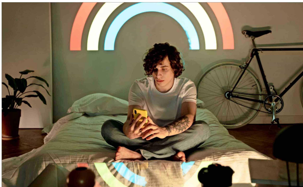
Múltiples estudios indican que los jóvenes prefieren chatear o navegar por internet antes que salir de noche.

"Estamos ante un cambio cultural. Esta es una generación