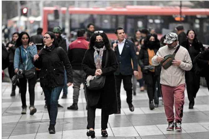
El estudio analiza la desaceleración del crecimiento económico del país en los últimos años, donde se pasó de una variación real del 9,2% en 1995 a un 3,9% en 2018 y a un 0,2% en 2023.