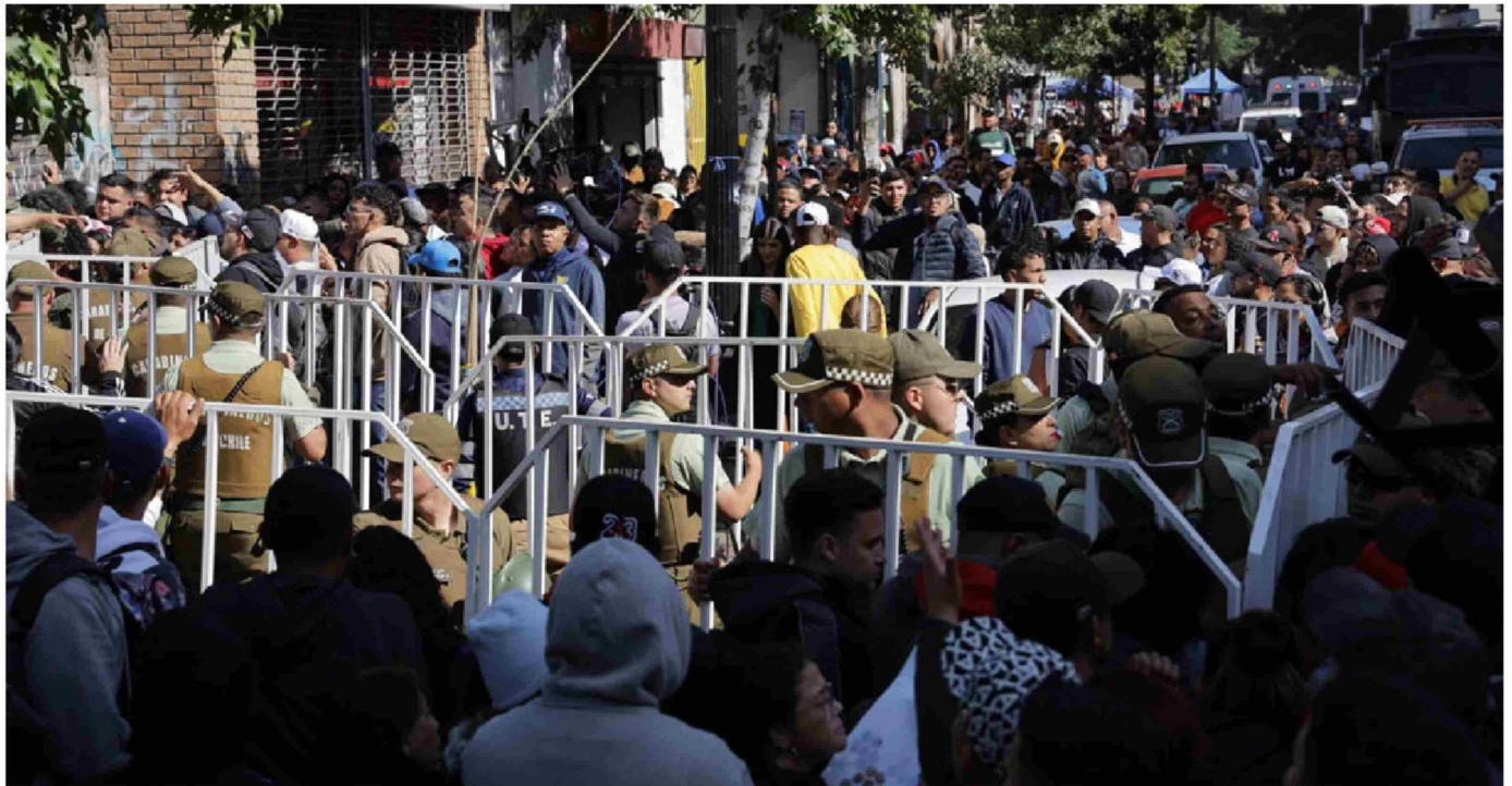
► A eso de las 07.00 horas más de dos mil personas migrantes ya estaban aglomeradas en Estación Central para iniciar su proceso de enrolamiento.