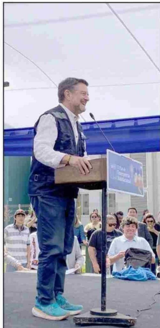
Claudio Orrego, gobernador de Santiago, en ceremonia de entrega de llaves