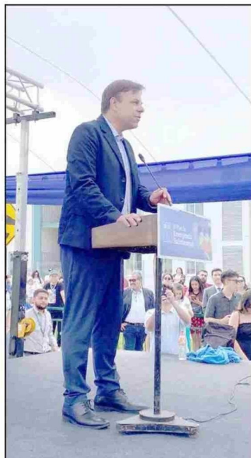
Alcalde Germán Codina en ceremonia entrega de llaves del proyecto ubicado en Bajos de Mena

Comisaría de Bajos de Mena realiza rondas preventivas para aumentar la sensación de seguridad entre los vecinos y vecinas. También, desde el municipio han trabajado fuertemente en resguardar la seguridad en el sector.