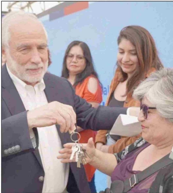
Carlos Montes, ministro de Vivienda y Urbanismo entregando llave de vivienda en Costa Azul.

de San Pedro, exigiendo mayor seguridad. Esto tras una ola de robos con intimidación a personas que espera-