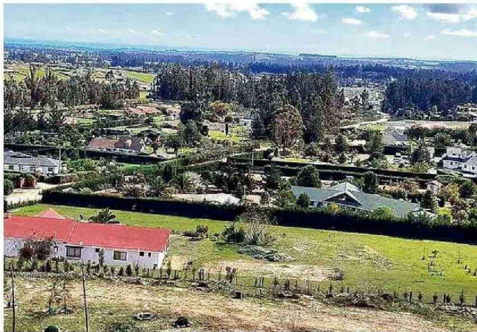
LA LOCALIDAD DE LEYDA EN LA COMUNA DE SAN ANTONIO.

Las obras a ejecutar contemplan retiro de asbesto de cemento, cambio de cubierta, ampliación del hall del acceso, para habilitar un comedor y un