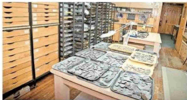
Laboratorio de micro paleontología.

"Nosotros decimos que no puede haber desarrollo sin conservación, pero tampoco puede haber conservación sin desarrollo. Deben ir de la mano".