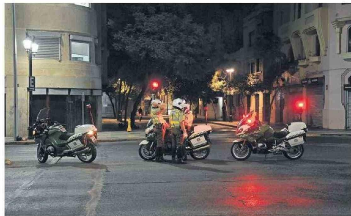
Ayer se levantó el toque de queda para las regiones afectadas.

Olmedo reiteró además que la falla fue "hasta el momento una operación no deseada del sistema de protecciones, o sea, el sis-